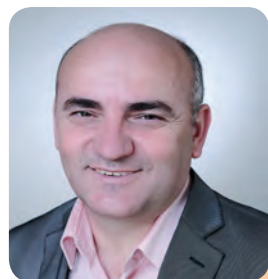
Nue Oroshi Stellv. Migrationspolitischer Sprecher